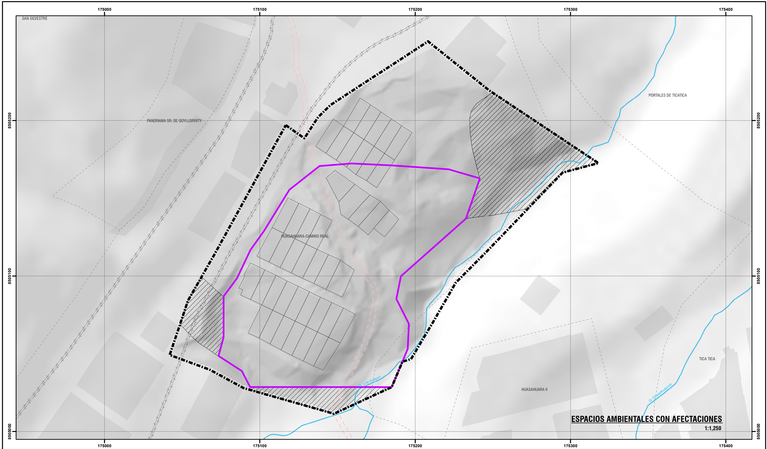
ESPACIOS AMBIENTALES CON AFECTACIONES 1:1,250